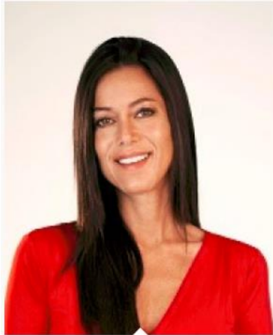
JOSEFINA MONTENEGRO PRESIDENTA