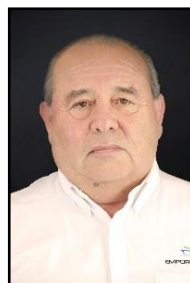
Gerente de Operaciones Ingeniero en Transportes