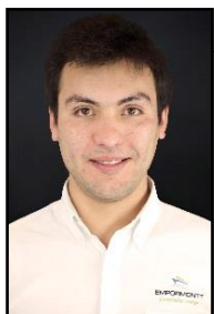
Gerente Comercial Ingeniero Civil Industrial