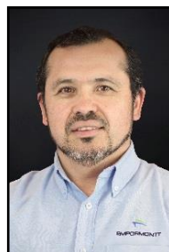
Gerente de Administración y Finanzas Contador Público y Auditor