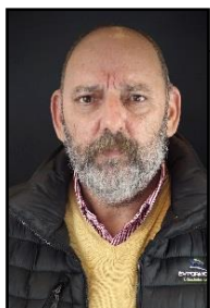
Gerente General Ingeniero de Ejecución Industrial